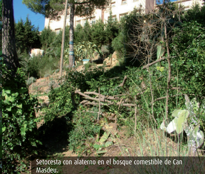
Setocesta con alaterno en el bosque comestible de Can Masdeu.