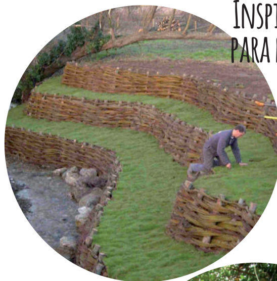
IMAGEN 1. EL ENTRAMADO DE RAMAS SIRVE PARA RETENER LA TIERRA Y CREAR TERRAZAS.

La idea general de que la permacultura se dedica solo al cultivo de alimentos, al huerto, limita mucho esta disciplina holística. Sin duda, producir nuestra propia comida está en la base del concepto de permacultura; de todas formas no siempre es posible crear un huerto a causa de escasez de suelo cultivable, ni un huerto es la única respuesta a la necesidad de producir comida y tampoco es el único factor del diseño permacultural.