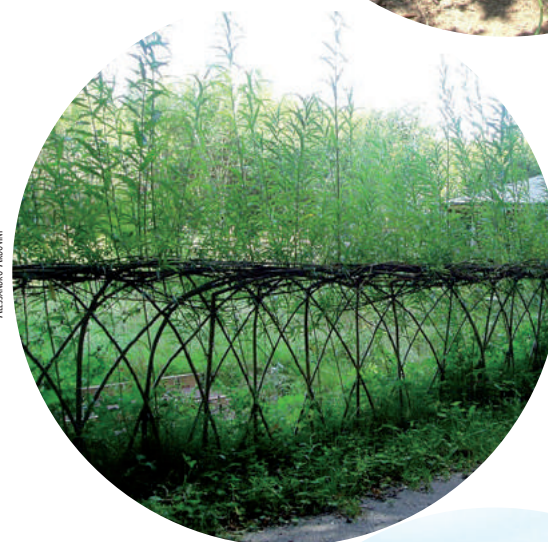
IMAGEN 3. CON LOS SAUCES ( SALIX spp.) SE PUEDEN CONSTRUIR SETOS VIVOS.