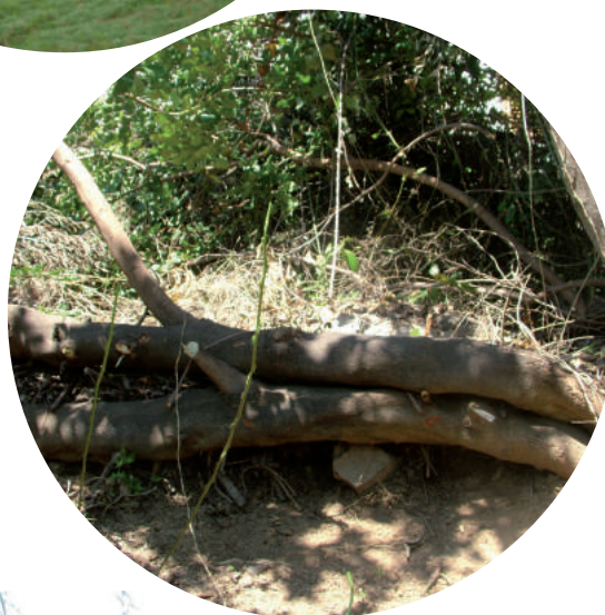
IMAGEN 2. LAS RAMAS DE ESTE ALGARROBO ( CERATONIA SILIQUA ) FUERON USADAS PARA PARAR LA EROSIÓN Y CREAR UNA TERRAZA DETRÁS DE ELLAS.