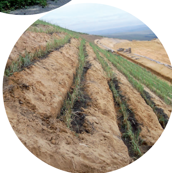
IMAGEN 4. PLANTACIÓN DE VETIVER ( CHRYSOPOGON ZIZANIOIDES ) DISTANCIADAS UN PALMO, LA UNA DE LA OTRA, A LO LARGO DE LAS CURVAS DE NIVEL, SE PREVIENE LA EROSIÓN GRACIAS A LAS PROFUNDAS RAÍCES DE LA PLANTA.

je en permacultura, llegué a analizarlas y fusionarlas para crear las setocestas.